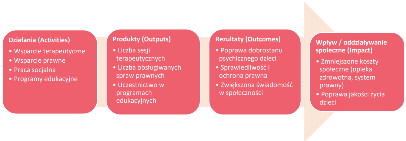
Ryc. 2. Model wpływu społecznego działań CPD.

Mapa oddziaływań została skonsultowana i uzupełniona podczas pięciu spotkań oraz w drodze korespondencyjnych konsultacji z ekspertami z CPD w Starogardzie Gdańskim. Czytając mapę warto mieć na uwadze, że końcowe efekty (korzyści) analizowanych działań, to nieprzeliczone na wartość finansową: zwiększona wydajność (możliwa dzięki możliwości współpracy interdyscyplinarnej w jednym miejscu), większa efektywność dostarczanych usług (dzięki synergii działań różnych specjalistów i współpracy międzyinstytucjonalnej) oraz długofalowa poprawa rozwoju i dobrostanu klientów CPD jako skutek udzielonej pomocy.